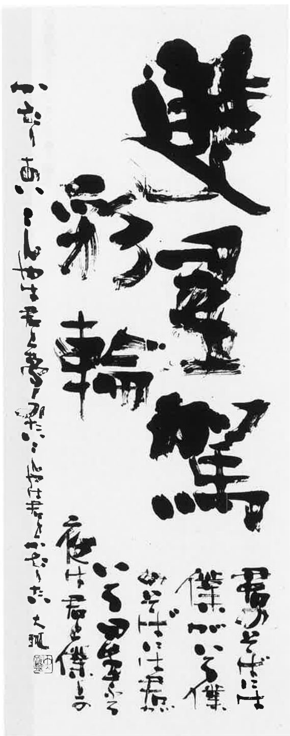
H 2年 1990年 42才 第26回創玄展 (1990) (182×79)

雙星駕彩輪・君のそばには僕がいる僕のそばには君がいる星ふる夜は君と僕とのかたりあいこんやは君と夢みたいこんやは君とかたりたい（自作）